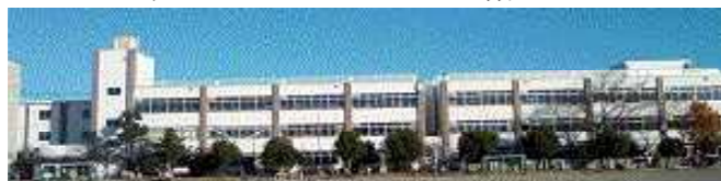
50年前に作られた校舎が生まれ変わりました。

各階のイメージカラーは(廊下・流し・ドア) 校歌の1番から 若き緑ぞ → 3階は緑 2番から 荒川の → 2階は青 3番から 桜堤に → 1階はピンク