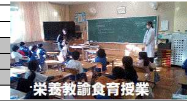
栄菱教諭食育授業