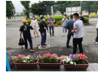
検温ボランティア 検温チェックを「おやじの会」と保護者の方々に手伝ってもらっています。