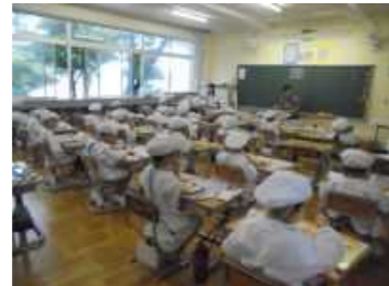
全員前向き給食 マスクをとってだまって食べる