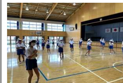
ソーシャルディスタンス体育 間隔をとって体育授業