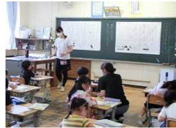
プリントを使った濃縮授業 授業の効率化・個別対応