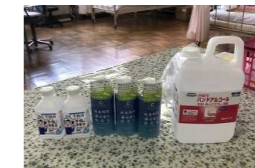
寄贈いただきました アルコール消毒液 液晶テレビ 保護者・電器店から