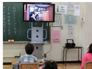
ICTの授業への積極導入 電子黒板・デジタル教科書・タブレット