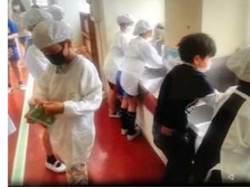
手洗いの習慣化 全員が20秒の正しい手洗いを