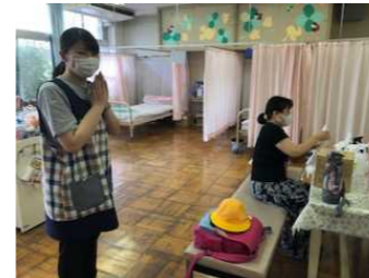
保健室ボランティア 第2第3保健室対応に備えて保護者の方にお手伝いしていただいています。

分散登校から1か月立ちました。学校がリスタートするにあたり、様々なお手伝いをいただいています。ありがとうございます。石原小学校の保護者のみなさん、石原小学校区のみなさんの温かい応援に感謝しています。これからもよろしくお願いいたします。