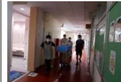
給食配膳方法の変更 密を避ける分散配膳