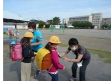
朝の全員検温チェック コロナ対策健康の確認徹底