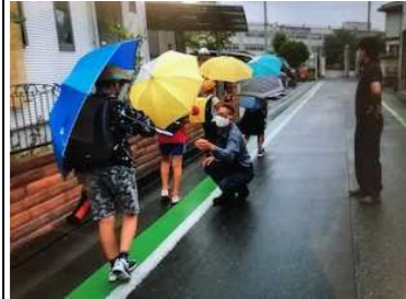
傘さし登下校 コロナ対策と熱中症予防の両立