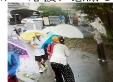
登校付き添いボランティア 保護者の方々に登校支援していただいています。

アルコールが今後入荷する見込みになりました。ご心配をおかけしました。寄贈いただいたアルコールは児童に使わせていただいています。ありがとうございました。